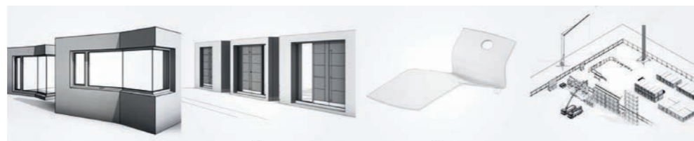
Revit 2019 umfasst jetzt über 5.000 neue Objekte

Zur Förderung einer noch besseren BIM-Arbeitsweise wurde eine gemeinsame Vorlagendatei für die Architektur und den Ingenieurbau entwickelt. Ab jetzt heißt es für alle Architekten, Tragwerksplaner und Gebäudetechniker in Deutschland, Österreich und der Schweiz: noch besser planen mit Revit.