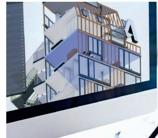
BIM Beispiel-Projekt in Revit 2019 erleben

Das preisgekrönte Wohn- und Geschäftshaus „Golden Nugget“ in Graz dient als Vorlage für ein durchgängiges BIM Beispiel-Projekt in Revit 2019. Hier erleben Architekten, Bauingenieure und Gebäudetechniker die Funktionalitäten von Revit am originalgetreuen 3D-Modell.